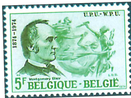
Sello belga emitido en 1974 con motivo del centenario de la Unión Postal Universal, conmemoración a la que se sumaron numerosos países.

revistas especializadas y álbumes son controlados por este organismo, que establece normas de actuación en cuanto a catalogación, precio y situación en el mercado, y que vela por la seriedad de las publicaciones evitando partidismos y falsas informaciones. Por su parte, los expertos filatélicos, especializados en la peritación de los sellos y en la realización de informes sobre las emisiones clásicas o conflictivas, pueden operar a título individual, pero deben pertenecer a la Asociación Internacional de Expertos Filatélicos (AIEP), organización