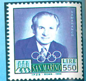
Sello de San Marino de 1984 dedicado a Juan Antonio Samaranch, presidente de la Federación Internacional de Filatelia Olímpica (FIPO).

A instancias de Juan Antonio Samaranch, presidente del Comité Olímpico Internacional y reconocido coleccionista de sellos de temática deportiva (su colección, hoy expuesta en el Museo Olímpico de la ciudad suiza de Lausana, ha sido premiada en diversas ocasiones en las principales exposiciones internacionales), se creó el 7 de diciembre de 1982 en el castillo de Vidy (Lausana) la Federación Internacional de Filatelia Olímpica (FIPO). Su fin es potenciar el coleccionismo de sellos relacionados con los juegos olímpicos, y cuenta con publicaciones especializadas en este tema. Gracias a su labor divulgativa y a que todas las administraciones postales, en un momento u otro de su historia filatélica, han dedicado emisiones a las olimpiadas, hoy en día, son muchos los países cuyas federaciones nacionales, dentro del organigrama de la FIP, agrupan clubs y asociaciones que están especializados en temas olímpicos y que promueven las exposiciones monográficas. Entre éstas, destaca la internacional «Olymphelex», que acompaña como acto cultural a todos los juegos olímpicos desde la fundación de la FIPO.