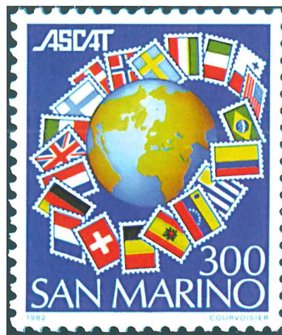
Sello de San Marino emitido en 1982 en conmemoración del quinto aniversario de la Asociación Internacional de Editores de Catálogos de Sellos Postales (ASCAT).

Paralelamente a los servicios postales ofrecidos por las diferentes administraciones existen los Servicios