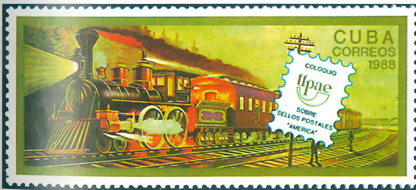
Sello emitido por Cuba en 1988 con motivo de la conferencia de la Unión Postal de América y España (UPAE), organismo regional en el seno de la UPU.

de los países que forman la Federación Internacional de Asociaciones de Comerciantes de Sellos (IFSDA). Ésta celebró su primera asamblea en 1952 y desde entonces se han incorporado más de 4.500 profesionales a través de sus asociaciones nacionales. Su finalidad es defender y promover el comercio de sellos, colaborando con la FIP y las administraciones postales en exposiciones,