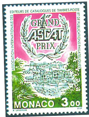
Sello de Mónaco de 1994 dedicado al Gran Premio convocado por la ASCAT.