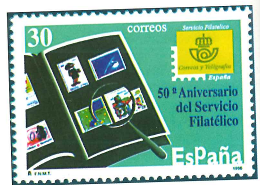
Sello español emitido en 1996 en conmemoración del cincuenta aniversario del Servicio Filatélico de Correos de España.

A instancias de Juan Antonio Samaranch, presidente del Comité Olímpico Internacional y reconocido coleccionista de sellos de temática deportiva (su colección, hoy expuesta en el Museo Olímpico de la ciudad suiza de Lausana, ha sido premiada en diversas ocasiones en las principales exposiciones internacionales), se creó el 7 de diciembre de 1982 en el castillo de Vidy (Lausana) la Federación Internacional de Filatelia Olímpica (FIPO). Su fin es potenciar el coleccionismo de sellos relacionados con los juegos olímpicos, y cuenta con publicaciones especializadas en este tema. Gracias a su labor divulgativa y a que todas las administraciones postales, en un momento u otro de su historia filatélica, han dedicado emisiones a las olimpiadas, hoy en día, son muchos los países cuyas federaciones nacionales, dentro del organigrama de la FIP, agrupan clubs y asociaciones que están especializados en temas olímpicos y que promueven las exposiciones monográficas. Entre éstas, destaca la internacional «Olymphelex», que acompaña como acto cultural a todos los juegos olímpicos desde la fundación de la FIPO.