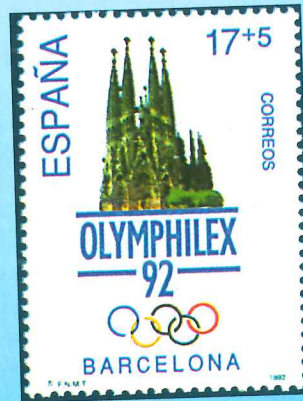
Sellos de San Marino (1987) y España (1992) que conmemoran sendas ediciones de la «Olymphelex».