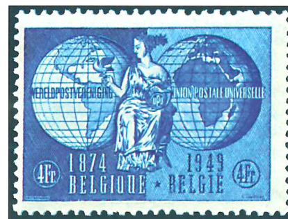
Sello de Bélgica emitido en 1949 que conmemora el septuagésimo quinto aniversario de la Unión Postal Universal.

Filatélicos de Correos (SFC). Su objetivo es facilitar a los coleccionistas la adquisición de los sellos y los efectos postales, previo abono o en venta directa en las ventanillas de la administración de correos.